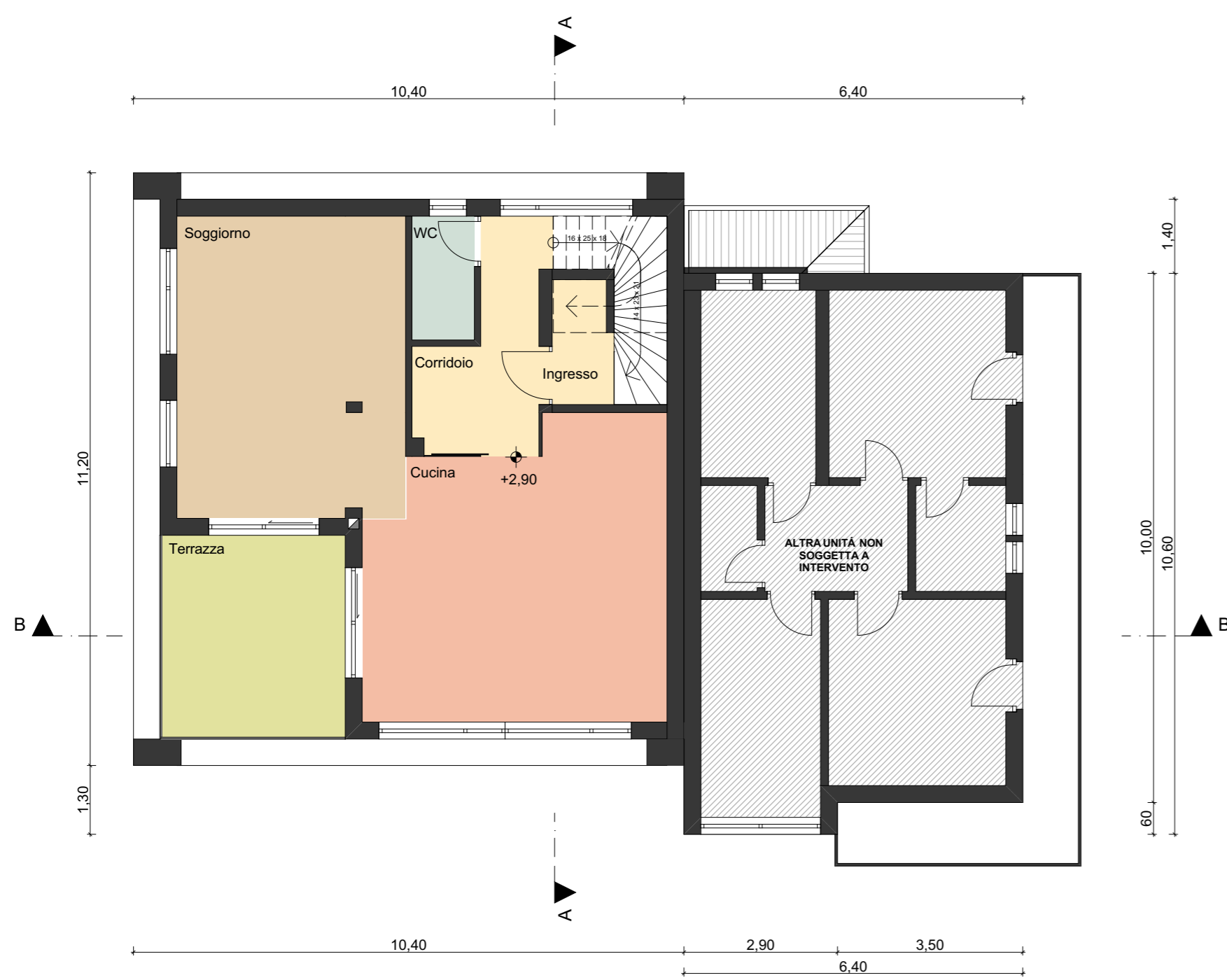
Pianta Piano Primo